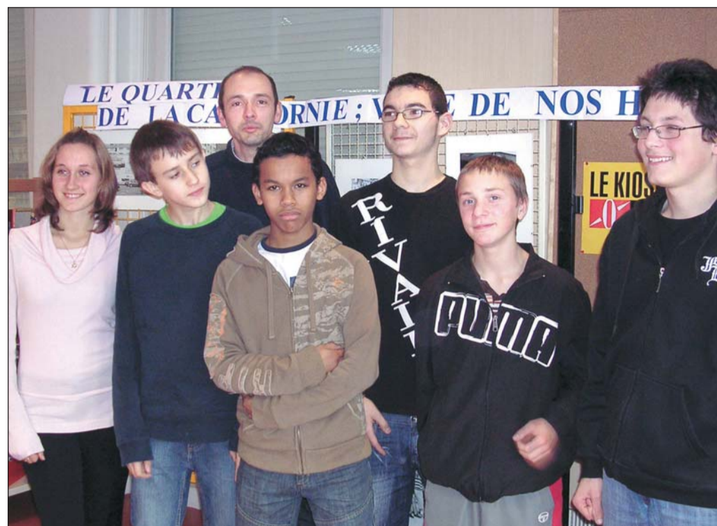
La mini-entreprise de Camus Jarville.

Depuis deux mois, tous ces jeunes gens appréhendent le monde de l'entreprise par le biais de l'appropriation : « La découverte de l'entreprise, c'est le principe même de l'option DP3 en troisième. Jusqu' alors on le faisait en allant visiter. Cette année, nous avons choisi ce concours. C'est un vrai challenge à relever pour les élèves qui ne jouent pas. Ils sont dans la réalité. » Pour répondre au cahier des charges, les huit collégiens doivent se constituer un capital de 300 à 500 euros. Ils sont en pleine phase de vente des actions : « Au prix de 4 euros. Nous